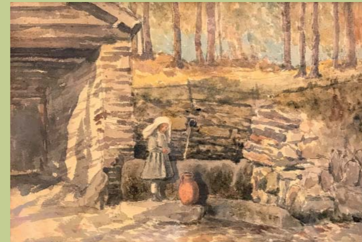
Abbildung Gustav Bauernfeind Mädchen am Brunnen, 1873 bis 1877

Kunststiftung Paul Kälberer Paul-Kälberer-Weg 19 72172 Sulz am Neckar-Glatt