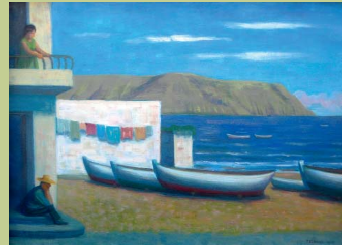
Abbildungen Paul Kälberer Dorf im Tessin (Ritorto im Bavonatal I), 1959 Boote am Strand von Los Christianos, 1970–1972 © VG Bild-Kunst, Bonn 2025

Die Ausstellung mit dem Untertitel „Auf Reisen“ zeigt malerische und grafische Arbeiten Paul Kälberers von Reisen nach Oberbayern, in die Schweiz, nach Teneriffa und in die Niederlande. Ergänzt wird die Ausstellung durch Werke zur Schweiz des aus Sulz stammenden Künstlers Gustav Bauernfeind (1848–1904).