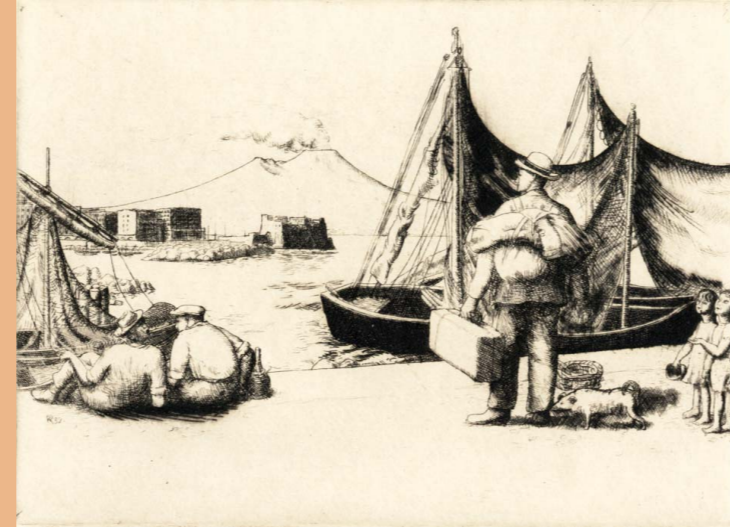
Abbildung Paul Kälberer Reisender in Neapel, 1932

Bauernfeind-Museum Untere Hauptstraße 5 72172 Sulz am Neckar