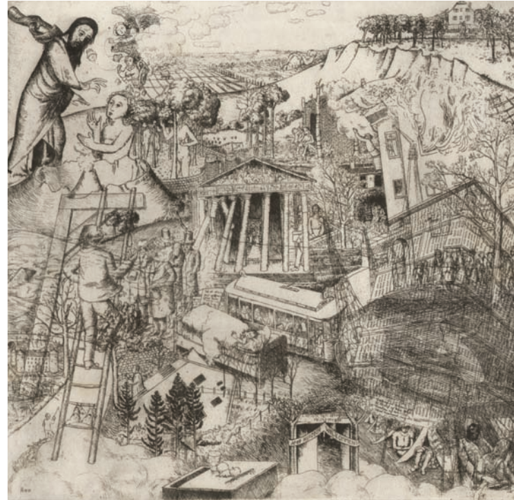
Paul Kälberer Fiebertraum Radierung 1927